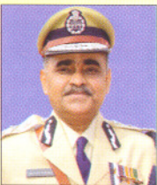
A. N. Upadhyay Director General of Police Chhattisgarh

CITIZEN COP application will be very helpful in making a bridge between police and public. This mobile application will be very helpful for the police department to provide better services to its citizens. The common people can easily communicate with the police by various means like videos, audio, photo etc. Features like "Help Me", "My Safe Zone", 'Auto fare calculator' & 'Towed vehicle search' are particularly very useful to the common man on the street.