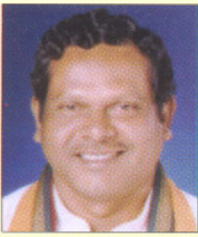
Ram Sewak Paikra Hon'ble Home Minister Chhattisgarh

CITIZEN COP is a mobile-based public safety application that will allow users to communicate effectively with the Police officers. In today's modern age, such services are the need of every citizen. Citizen COP will not only empower people to become citizen police by reporting crime and traffic violations, but also report violation by police personnel and make suggestion for empowered policing. I call upon all members of the police force to make use of this application to reach out to the citizens to ensure a safe and secure environment to all the citizens in distress.